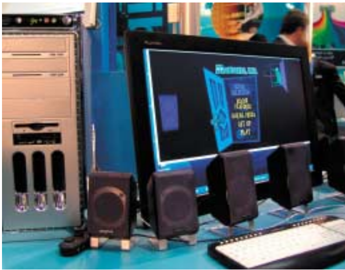
6-Kanal-Audio ist mit den heutigen Standards problemlos möglich. Der neue Standard HDA wird noch einen weiteren Kanal bringen und erfüllt so die Voraussetzungen für ein Homecinema ab PC