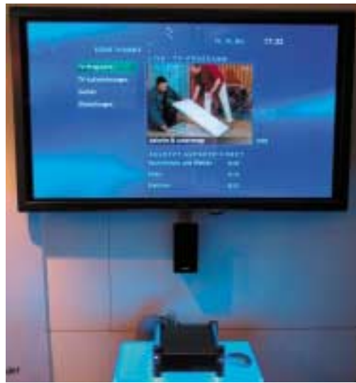
Der Schweizer Hersteller Digital-Logic zeigte voller Stolz sein Microspace Entertainment Center MEC mit der Microsoft-Benutzeroberfläche MCE