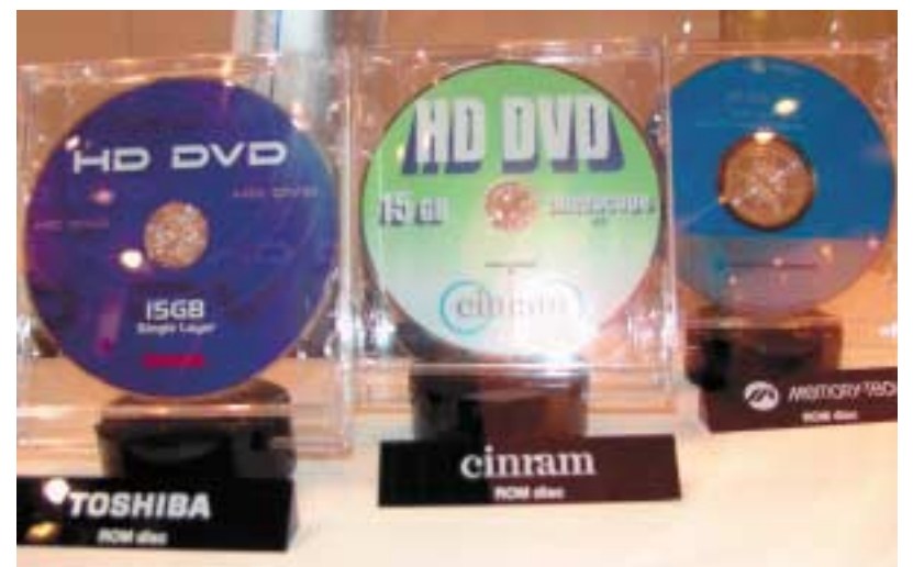
Die Konkurrenz zu Blue Ray Disk war natürlich auch vertreten und zeigte ihre ersten HD DVD-ROM-Rohlinge mit einer Kapazität von 15 Gigabyte

ser Service noch nicht vollumfänglich mit allen lokalen Sendern bereitsteht.