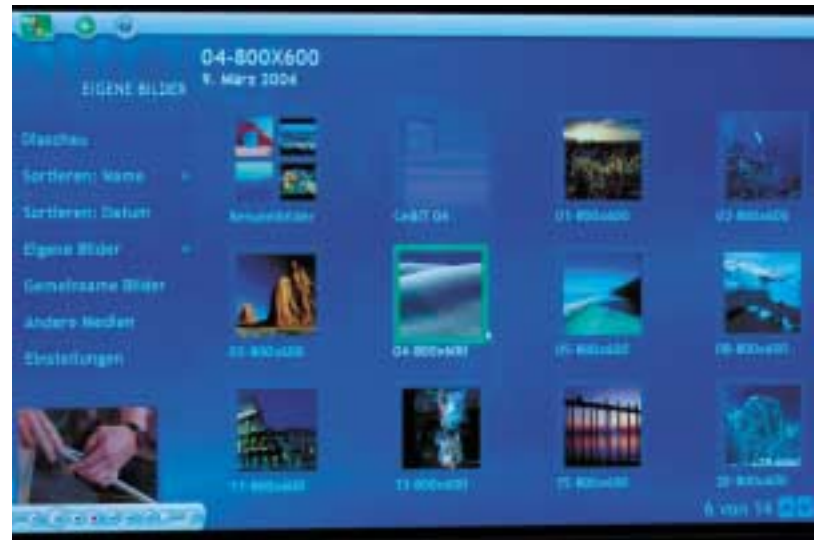
Die Benutzeroberfläche MCE lässt sich sehr einfach mittels spezieller Fernsteuerung bedienen. Man springt von Menüpunkt zu Menüpunkt, sucht sich seine TV-Kanäle oder Bilder und löst durch Knopfdruck die Aktion aus