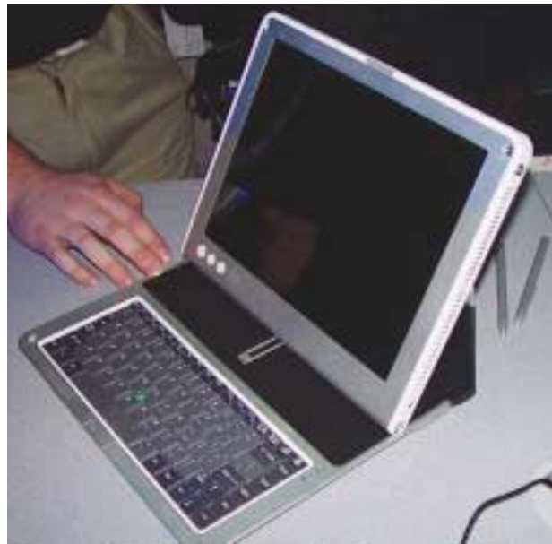
Konzeptstudie Newport zeigt ein mobiles wandelbares Notebook, das permanent eingeschaltet ist und so immer Mails und Meldungen empfangen kann. Dank ausgeklügelten sparsamen Komponenten und Software kann es über acht Stunden netzunabhängig arbeiten