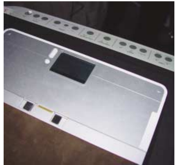
Damit die Funktion «Allways ON» auch gelebt werden kann, werden wichtige Infos (SMS, Mail usw.) in einem kleinen Display im Deckel angezeigt, ohne dass das Notebook geöffnet werden muss

Intel Developer Forum, San José (CA), USA (Fortsetzung von Seite 37)