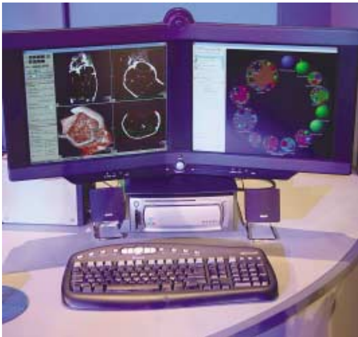
Business-Arbeitsplatz als Konzeptstudie Marble Falls: Doppeldisplay, Videokamera, Mikrofone, kabellose Verbindungen nach aussen und platzsparendes Design