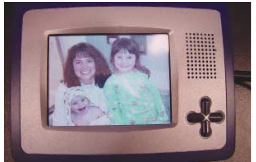
Neuartige Kleingeräte ermöglichen den drahtlosen Empfang von Bildern, Videos aber auch unterschiedlichster Meldungen

aber auch das persönliche mobile Umfeld stark verändern. Im mobilen Umfeld ist vor allem die Integration von Rechnungsleistungen in Handys oder der Einbau von Kommunikationsfunktionen in Kleincomputern wie PDAs interessant.