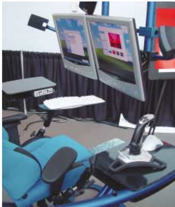
Arbeitsplatz der Zukunft oder luxuriöser Spielplatz für Profi-Gamer?