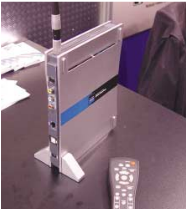
Der digitale Media Adapter verbindet mittels der Wireless-LAN-Technologie PC mit Geräten der Unterhaltungselektronik