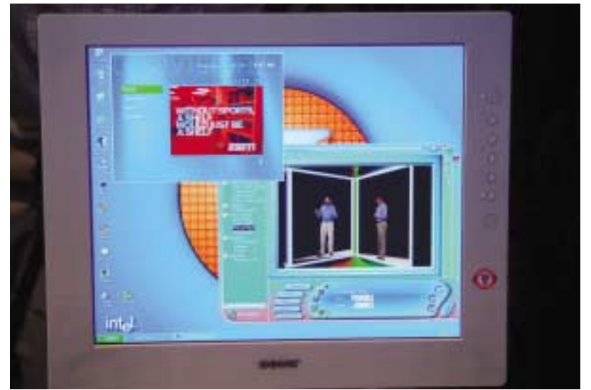
Mit dem neuen Canterwood-Chipsatz mit seinen hohen Leistungsmerkmalen sind auch sehr anspruchsvolle Darstellungen aus dem Video-Bereich ohne Unterbrechungen möglich