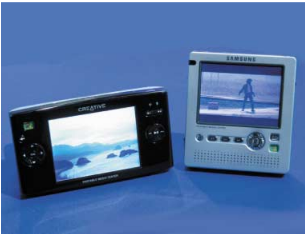
Diese PMP-Geräte (Portable Media Player) von Creative Labs und Samsung zeigen den Weg zu leistungsfähigen Taschengeräten welche Fotos, Audio und Video in höchster Qualität abspielen können. Die Daten werden mittels Funktechnologien übertragen